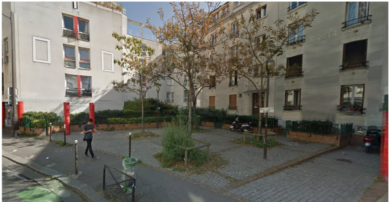
Rue des Haies, Paris