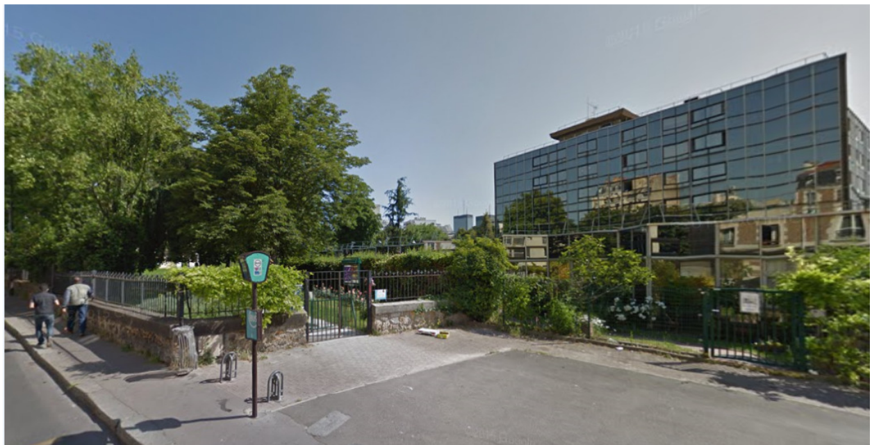
Rue des Balkans, Paris