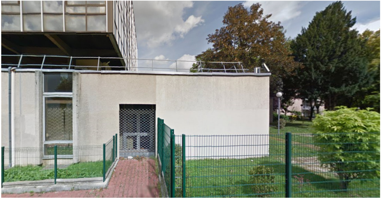
Allée Alquier-Debrousse, Paris