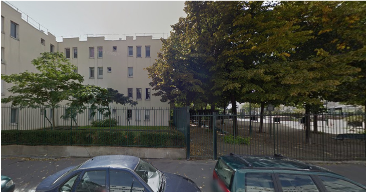
Rue Merlin, Paris